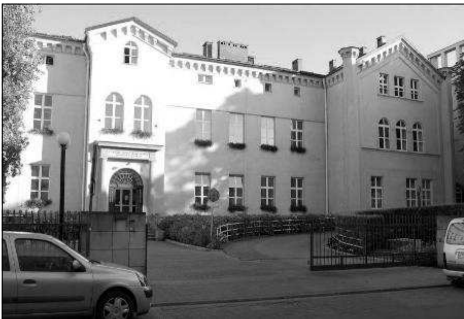
מבנה בית החולים היום.

ב-1808 מוזכר בית החולים היהודי לעניים, מיסודו של ארגון "ביקור חולים" השוכן בקזיימייז' בככר החדשה (Plac Nowy) על יד רחוב פודבז'ז'יה. כבר בימי הכיבוש האוסטרי נשמעו תלונות מצד השלטונות על הלכלוך בגטו, ובעיקר באיזור בית החולים, ואחרי השטפון