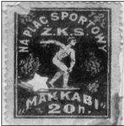
"בול" על תרומה לבניית מגרש מכבי

הרעיון הוא לארגן מפעל הנצחה וזיכרון ספורטאי קרקוב היהודיים שנרצחו בשואה : Memorial ZKSK (Memorial Zydowskich Klubow - Sportowych Krakowa) ובאנגלית Cracow International