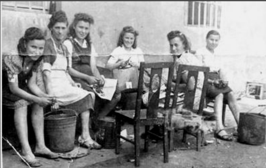
נערות יהודיות מועסקות בקילוף תפוחי אדמה עבור מטבח של הגרמנים

כאשר נגמרו הכסף והתכשיטים, הפך מקום העבודה למקור יחידי של מזון נוסף. הודות לעבודתן הבלתי פוסקת של נשים, לחיים בגטו היה עוד גוון של חיים "נורמליים".