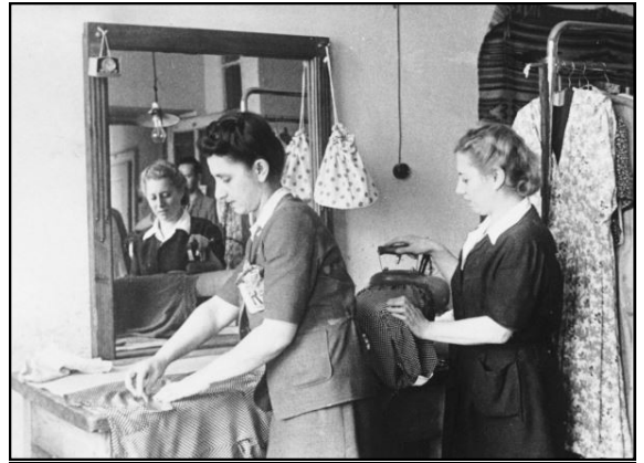
נשים יהודיות עובדות באחת המתפרות של מדריט' בגטו קרקוב

היו נשים שעבדו בהתנדבות כ-"אחיות" ב"צנטוס" וביקרו בדירות רבות על מנת לבדוק את תנאי החיים של הילדים, שם שרר רעב, עוני, צפיפות נוראה וזוהמה, שההורים הטרודים בעבודה לא יכלו להתמודד אתם. במוסדות סגורים היה המצב טוב יותר לפחות בשנה