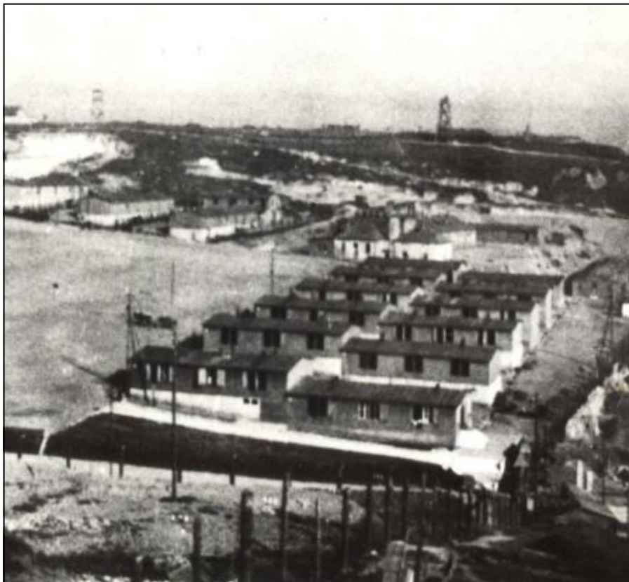
חלק מהצריפים במחנה פלשוב

לתדהמתי ראיתי שחלק מהצריפים מתוכנן בתוך גבולות בית הקברות עצמו. הרי לא נגור יחד עם המתים בין הקברות! ביקשתי שיחה עם המהנדס