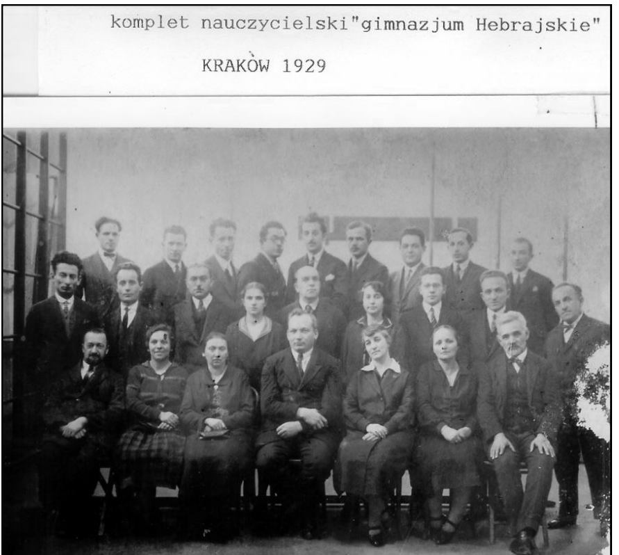
צוות מורי הגימנסיה העברית, קרקוב 1929. מישהו יכול לסייע בזיהויים?

התנאים הנוכחיים התאימו ביותר להחלטה על פתיחת כיתה א' של הגימנסיה הדו-לשונית. 15 התלמידים הראשונים היו רובם מקרב המסיימים את ארבעת הכיתות של ביי"ס עברי יסודי. לא הייתה כל תוכנית לימודים מפורטת, ולא הייתה התאמה לתוכניות הלימודים של המוסדות הממשלתיים, ואף ללא כל קשר