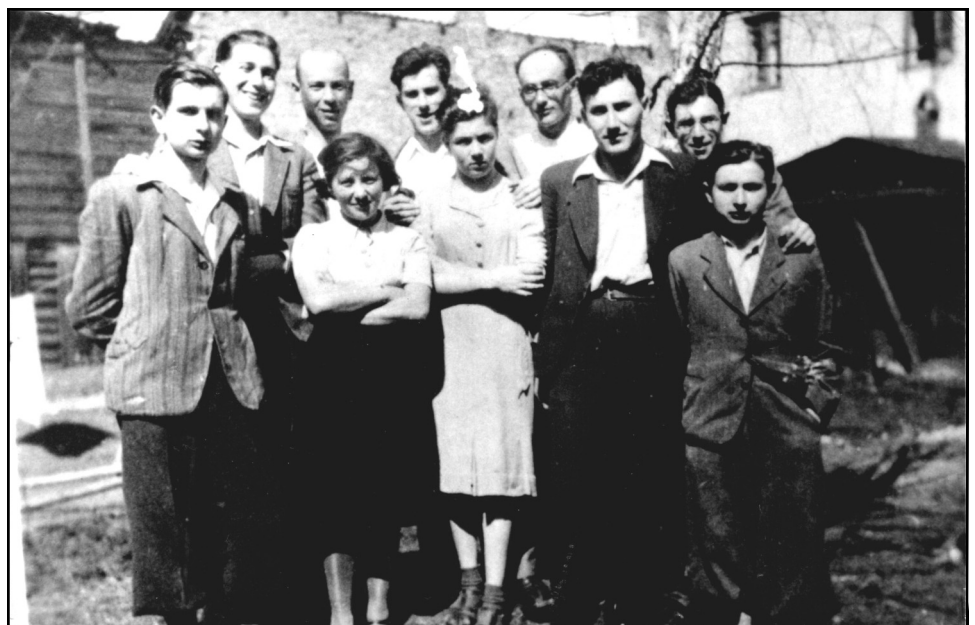
חברים בתנועת "עקיבא" בקרקוב, לפני המלחמה