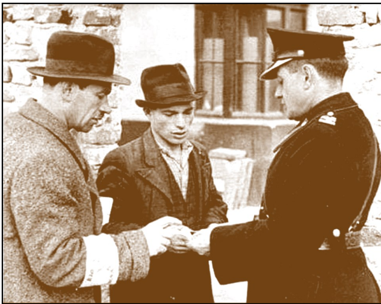
"שוטר כחול" בודק תעודות של שני יהודים ברחובות קרקוב, 1941

המשטרה הפולנית כונתה "המשטרה הכחולה" על שום צבע המדים שהיה כחול-כהה, והיא שיתפה פעולה עם המשטר הגרמני בפולין הכבושה, הן ביחס לאוכלוסייה הפולנית והן ביחס לאוכלוסייה היהודית.