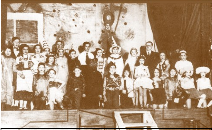
פורים בקרקוב שלפני המלחמה

בכרכרות האחרות ישבו בחורות הלבושות בשמלות קרנוליו, בסגנון המאה הקודמת. פניהן מכוסות ברשת עדינה, מצופה בשלל פתיתי זכוכית נוצצות, בידיהן מניפות המצננות את הפנים למרות הקור, על צווארן מחרוזות פנינים ואלמוגים, שיער ראשן מוגבה כלפי מעלה, מסולסל וקשור בסרטים בצבעי זהב. מראה פניהן כושתי אשת אחשוורוש ולא כאסתר הצדיקה. בחלק