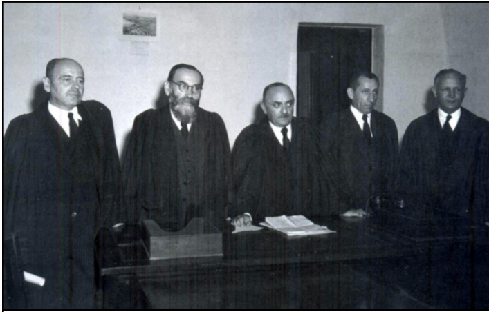
חמשת השופטים הראשונים של בית המשפט העליון.

עוד כנער היה בין מייסדי הספרייה העברית הראשונה בעיר, ספריית "עבריה", בה שימש כספרן ומזכיר. בשנת 1914 השלים את לימודי הדוקטורט במשפטים באוניברסיטה היגלונית והתחיל לעבוד בווינה ושנה מאוחר יותר עבר להולנד, שם למד ולימד שפות ולמד משפט מוסלמי. החל משנת 1907 היה פעיל בתנועה הציונית ובשנת 1917 הצטרף לקבוצה ציונית מקומית ושנתיים מאוחר יותר, בשנת 1919 עלה לארץ-ישראל יחד עם ועד הצירים.