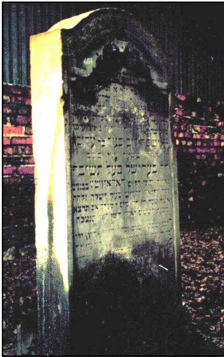
מגליציה המערבית לאחר ישועה ורפואה.