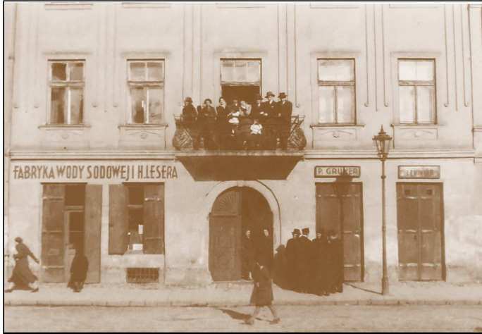
בית משפחת לזר בכיכר וולניצה 10. בני המשפחה עומדים במרפסת הבית הפונה לכיכר. משמאל: בית החרושת למי סודה של המשפחה.

בשעה מאוחרת של אחר הצהרים היה אב המשפחה מתיישב על יד השולחן, ועורך את הסעודה השלישית. בסעודה זו אכלו מעט, דג מלוח עם פרוסת חלה היו המאכל העיקרי, אבל הרבו לשיר זמירות, את כל שירי המעלות, והיו מסיימים ב"אין כאלוקינו". האווירה הכללית בסעודת המנחה היתה אוירת קודש, והאפולולית עוד הגבירה אותה.