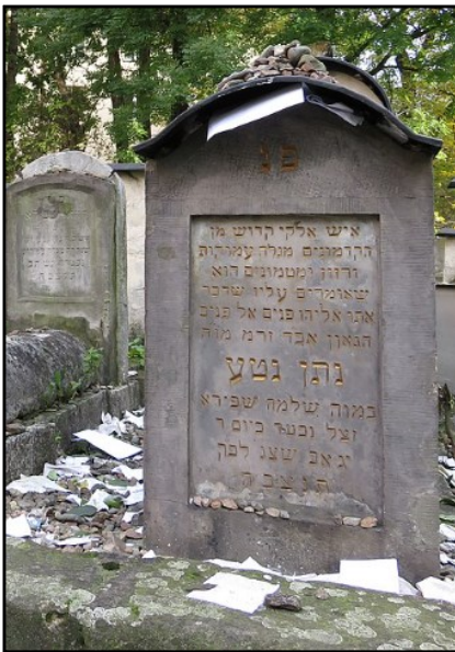
קבר "המגלה עמוקות" בבית העלמין "הישן" בקרקוב

במהירות מכיסאו וקרא, כשהוא מצביע על הדלת באצבעו: "הסתלק מעיני, שטן! שכף רגלך לעולם לא תדרוך עוד בקרקוב!" כך עבר רבי נתן נטע שפירא בהצלחה את המבחן.