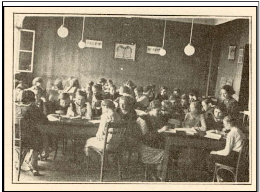
כיתה בבית ספר "בית יעקב", 1935

בשנת 1923 גדל המוסד לבנות "אוגניסקו פראצי" והפך לבית-ספר מקצועי לבנות, הוקם הסמינר למורות, בוגרות "בית-יעקב" (בשנת 1922, ע"י תנועת "אגודת ישראל"). בנוסף נפתח בשנת 1933 "בית הספר