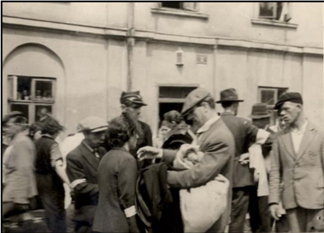
מסחר ברחובות גטו קרקוב

הגרמנים שוחחו איתו עוד זמן מה ושאלו אז, למה בעצם הוא דובר גרמנית טובה כל כך, והאם הוא פולני. לאחי לא היה סרט שרוול, אבל מפחד שהגרמנים ידרשו את הניירות שלו לא העז אחי לשקר ואמר שהוא יהודי. כאשר שמעו זאת הגרמנים השתנו מיד פניהם החביבות, הם התחילו להכות את אחי באכזריות ולהתעלל בו. אחד מהם הכניס את האקדח הבלתי נצור שלו לפיו של אחי ואמר שיירה בו. לאחר מכן אמר שהתחרט, ושאחי אמור להתפלל קודם. לאחר שעשה כך אמר הגרמני: "שים לב, אני סופר עכשיו עד שלוש וכשאגיע לשלוש, אירה בך." הוא הצמיד את האקדח לאחורי ראשו של אחי וספר, אבל כשהגיע לשלוש העניק לאחי במקום כדור חבטת אגרוף חזקה באחורי ראשו, כך שאחי כשל ונפל לתוך ערמת נוצות פוך שהיו מפוזרות במחסן על פני הרצפה לידו. כאשר רצה לנשום ולהוציא את הראש מערמת הפוך מילאו הגרמנים את פיו בנוצות, לאחר מכן היכו אותו במטאטא שעמד בפניה. כאשר התעורר אחי מעלפונו לא היה איש בחנות. הוא לא ידע בעצמו כיצד הגיע הביתה, ידו השמאלית כאבה מאוד והרופא קבע שהיא שבורה בשני מקומות.