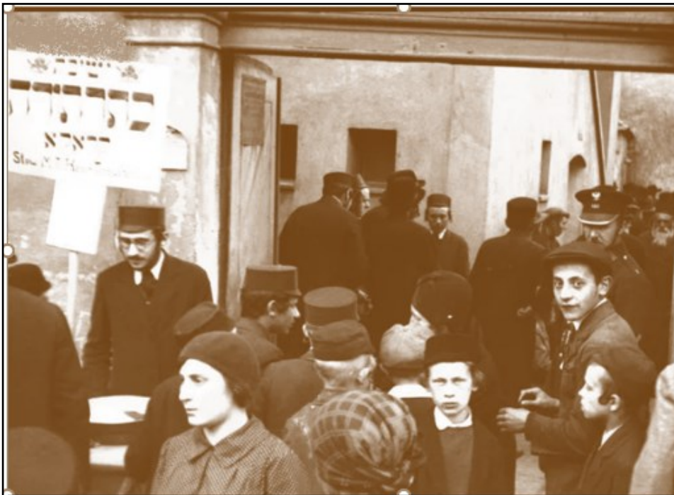
בחורים אוספים כסף עבור סניף ישיבת "כתר תורה" בקרקוב

ביום השנה לפטירתו של הרמ"א, בלי"ג בעומר, היו המונים עולים לקבר הרמ"א ומוסדות שונים היו מציבים בכניסה לבית הכנסת עמדות התרמה למוסדותיהם.