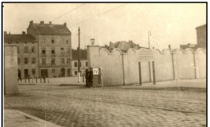
חומות והכניסה לגטו ומרחוק כיכר זגודי ובית המרקחת

מי שלא היה צופה ועד ישיר בתיאטרון זה של אימים וזוועה, אינו יכול להבין ולתפוס את הנסיבות, בהן חיו, כאן בני-אדם, לא יבין את העורמה הזדונית של השקרים,