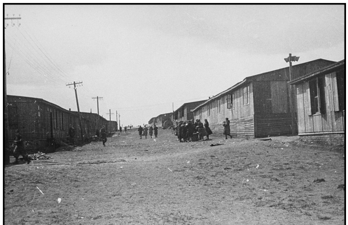
צריפים במחנה הריכוז פלשוב

הרי הילדים, למשל, זכו כידוע לטיפול מיוחד כזה. למטרה זאת גידרו שטח מיוחד בתוך מחנה הנשים ושיכנו את הילדים בצריף מספר 5. לזרים הייתה הכניסה אסורה לצריף הזה. הממונים על הילדים ועל צורכיהם היו נציגי המשטרה היהודית, האודמן קוד ואחרי כן סאלק גרינר. אבל גם הגרמנים דאגו למאתיים הילדים האלה. אקארט בכבודו ובעצמו דאג להם. לעיתים היה מחרים מסוחר