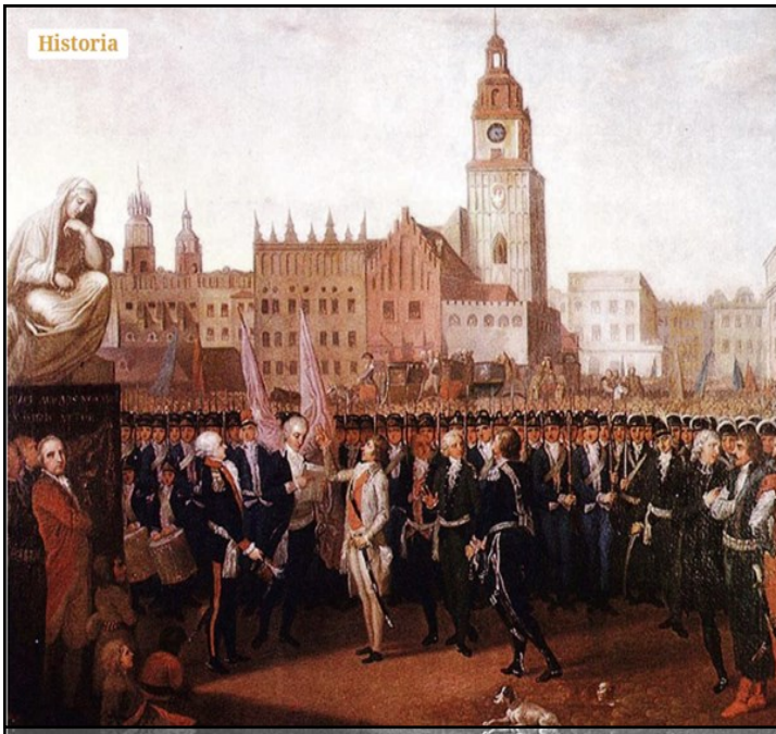
תדיאוש קושצ'יושקו נואם בכיכר המרכזית של קרקוב, 1794

ב-24 במרץ 1794 היה תדיאוש קושצ'יושקו בקרקוב ובנאום שנשא בכיכר הראשית של קרקוב הכריז על המרד. קושצ'יושקו רצה לכבוש את ליבה של האוכלוסייה היהודית, ולכן הגיע לבית הכנסת "הישן", שם נשא נאום בפני היהודים שהתאספו ובין היתר אמר כי הוא לא רוצה כלום לעצמו; הוא רק מודאג ממצבה העגום של מולדתו ואושרם של כל תושביה, כולל היהודים.