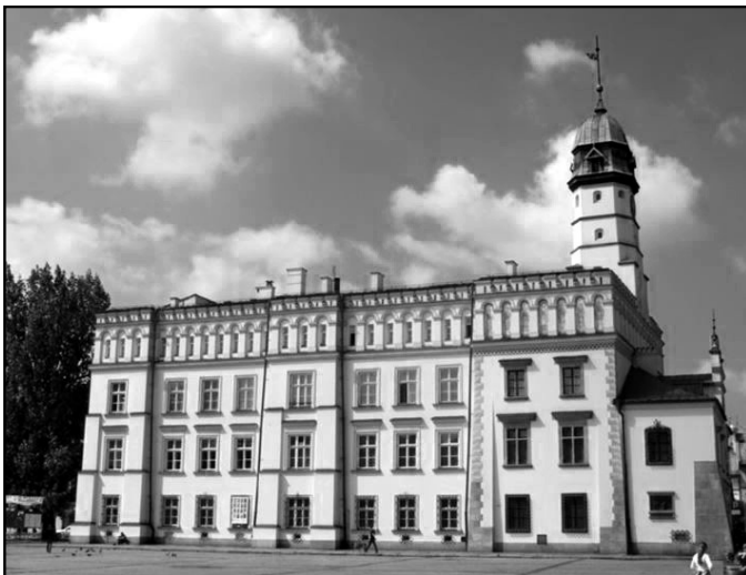
ה"רטוש" (בעבר בית העיריה של קז'ימייז') כיכר וולניצא

ובעצם למה אין אני מזכיר גם את כל האחרים שבמרובע גוש הבניינים בהם נמצאו חנותנו ודירתנו? (היה זה ברחוב בוז'גו צ'אלה, בית "הובלער", מול הכנסייה—ל.ה.)