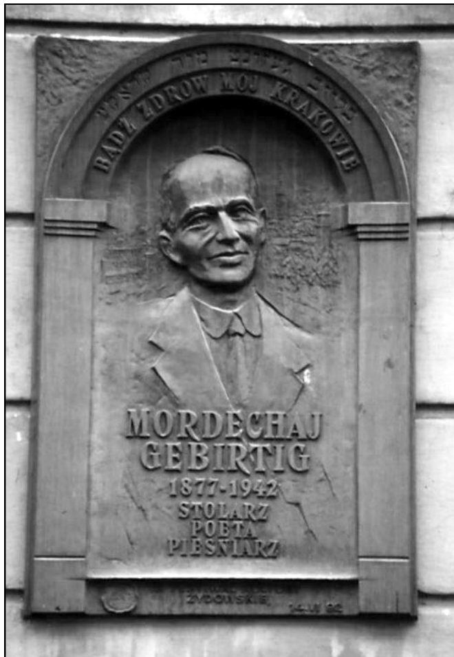
השלט לזכרו של מרדכי גבירטיג (1877-1942) על הבניין שברחוב ברק יוסלביץ 5

המקום הופך, אט אט, למוזיאון למורשתו של המשורר, ובכוונת היוזמות להוסיף גם פעילות חינוכית ואמנותית: שיעורי היסטוריה, סדנאות, תחרויות, פרויקטים מחקריים, תערוכות צילום, הקרנת סרטים,